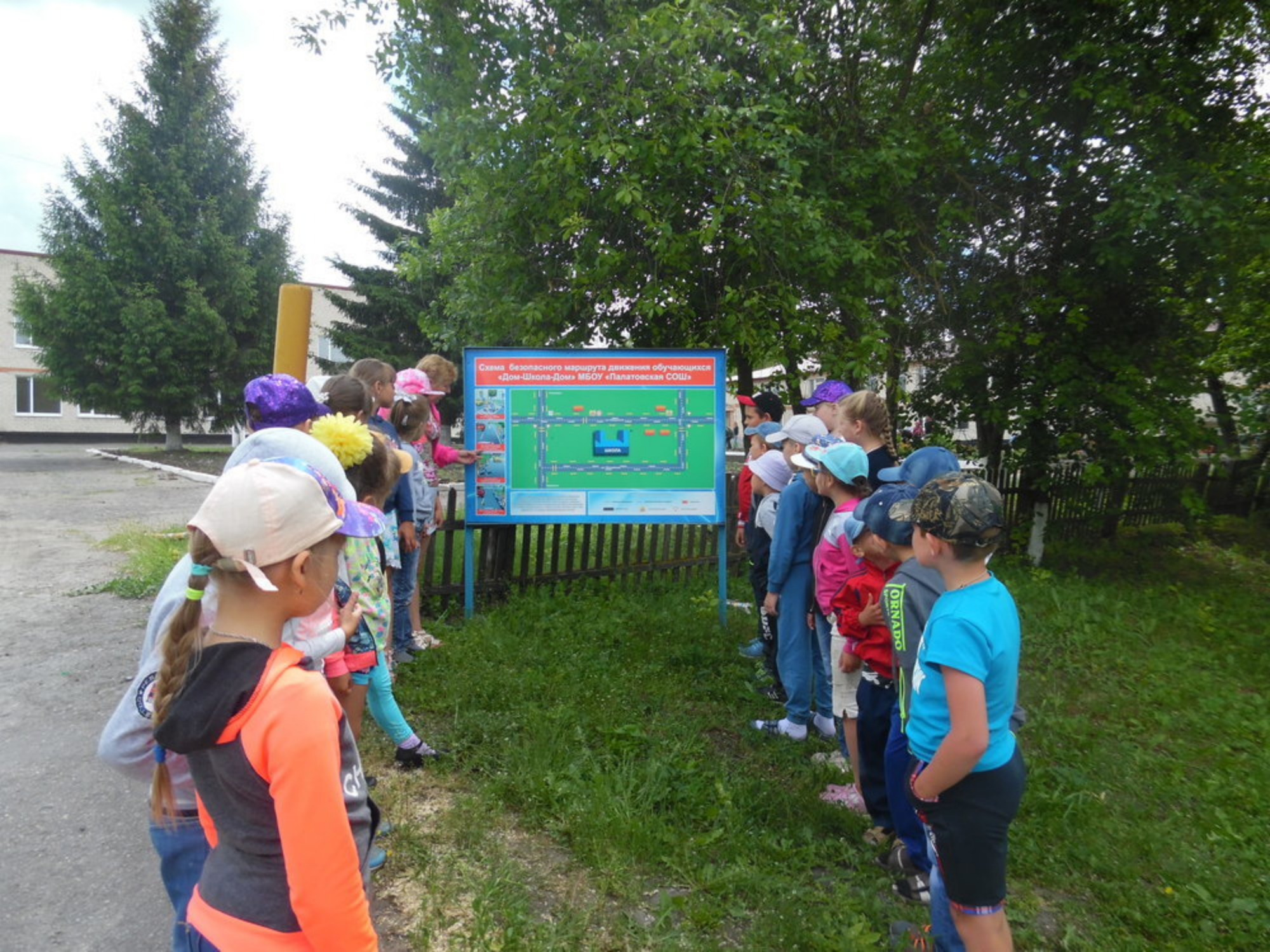
Схема безопасного маршрута движения обучающихся «Дом-Школа-Дом» МБОУ «Палатовская СОШ»